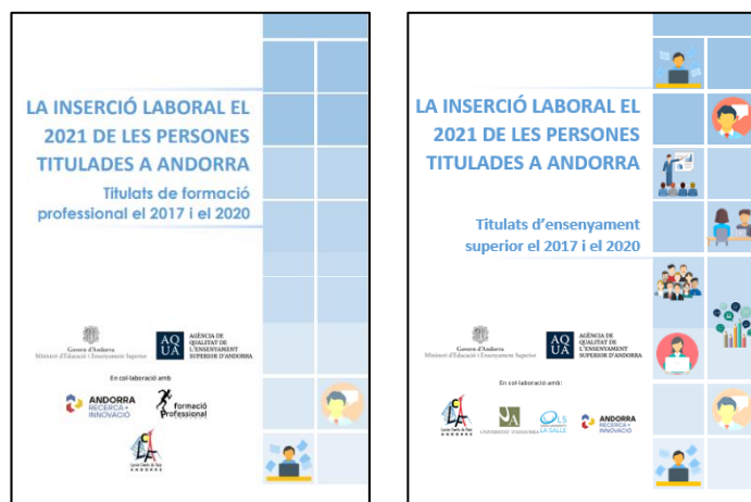
Figura 2. Portada dels estudis d'inserció laboral elaborats el 2021.

El 2021 s'han desenvolupat els estudis corresponents a les promocions d'ensenyament superior i de formació professional titulades el 2017 i el 2020 (vegeu la figura 2). Concretament, s'ha portat a terme la recollida i anàlisi de dades, en col·laboració amb el Grup de Sociologia d'Andorra Recerca + Innovació, i la difusió i presentació de les dades es portarà a terme durant el 2022. Els estudis estan disponibles als webs de l'AQUA i del MEES.