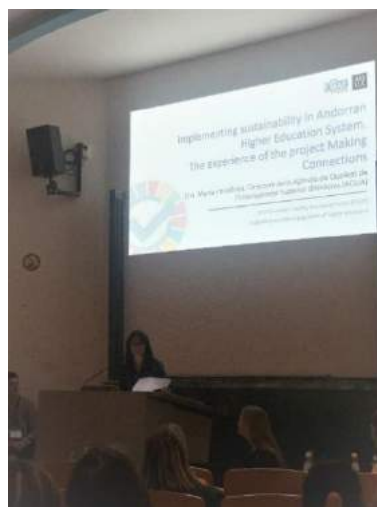
Figura 5. Presentació del projecte Making Connections al 2019 European Quality Assurance Forum (EQAF)