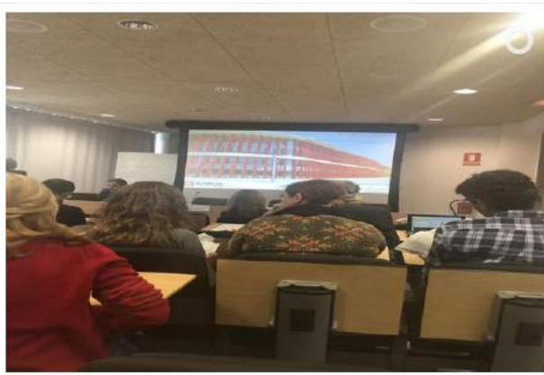
Sala de reunions.