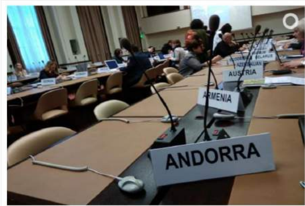
Sala de reunions de la catorzena trobada de l'Unece a Ginebra.