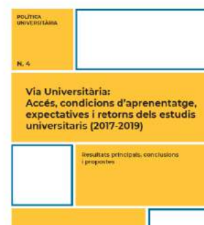
Figura 8. Estudi Via universitària: accés, condicions d'aprenentatge, expectatives i retorns dels estudis universitaris (2017-2019) de la Xarxa Vives

L'informe està disponible en línia en anglès i català.