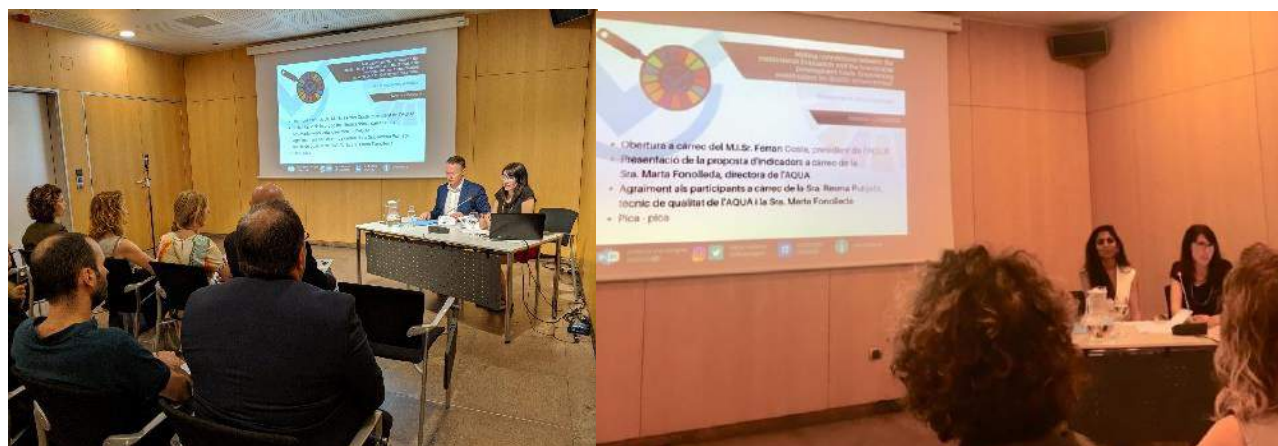
Figura 2. Acte públic de difusió de les conclusions del projecte Making connections