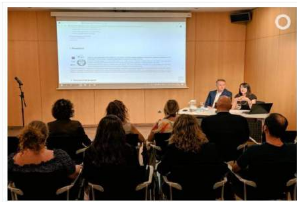
La presentació del document final va tenir lloc al Centre de Congressos.