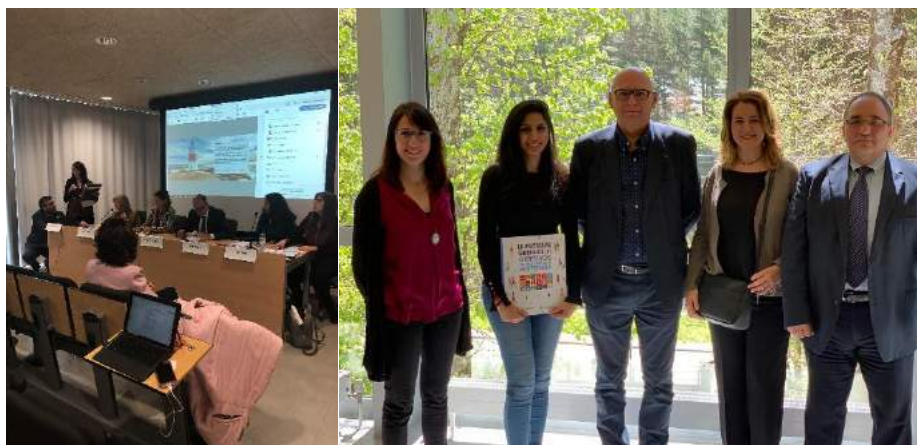
Figura 4. Trobada internacional "Embarcing QA Agencies and stakeholders in this collective journey"