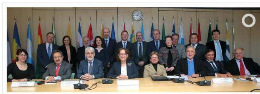
Els participants a les jornades constitutives del Siaces a Madrid.