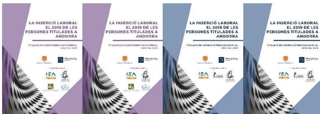
Figura 7. Portades dels estudis d'inserció laboral elaborats durant el 2019, disponibles a la web de l'AQUA

El 2019 s'ha desenvolupat la segona edició d'aquests estudis, corresponent a les promocions titulades el 2014 i el 2017, i la tercera edició, corresponent a les promocions titulades el 2015 i el 2018 (vegeu la Figura 7). La recollida i el tractament de dades s'han desenvolupat en col·laboració amb el Centre de Recerca Sociològica (CRES) de l'Institut d'Estudis Andorrans.