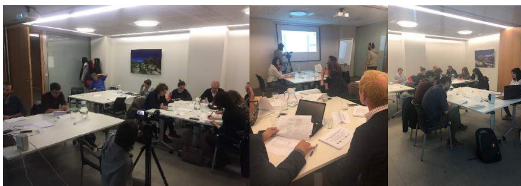
Figura 1. Sessió de validació dels indicadors celebrada a Andorra